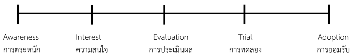
ภาพที่ 4.2 แบบจำลองกระบวนการยอมรับนวัตกรรม

เอเวอร์เรต เอ็ม โรเจอร์ส (Everett M. Rogers) มีชื่อเสียงโด่งดังเป็นที่ยอมรับการทั่วโลกจากทฤษฎีการสื่อสารนวัตกรรมหรือการเผยแพร่ข่าวสารของโรเจอร์ ได้รับการอ้างอิงไปอย่างแพร่หลาย โดยเฉพาะอย่างยิ่งในส่วนที่เกี่ยวข้องกับ “กระบวนการยอมรับนวัตกรรม” (Adoption process) ซึ่งเดิมได้อธิบายว่า คือ กระบวนการตัดสินใจในการยอมรับหรือปฏิเสธนวัตกรรม เป็นกระบวนการที่เกิดขึ้นในสมอง ที่บุคคลจะต้องผ่านขั้นหรือระยะต่างๆ ตั้งแต่แรกที่รู้เรื่อง หรือมีความรู้เกี่ยวกับนวัตกรรมไปจนถึงขั้นตัดสินใจที่จะยอมรับหรือปฏิเสธนวัตกรรม และในที่สุดถึงขั้นยืนยันการตัดสินใจที่ทำไปแล้ว กระบวนการรับนวัตกรรมนี้ ประกอบด้วย 5 ขั้นตอน ดังภาพที่ 4.2